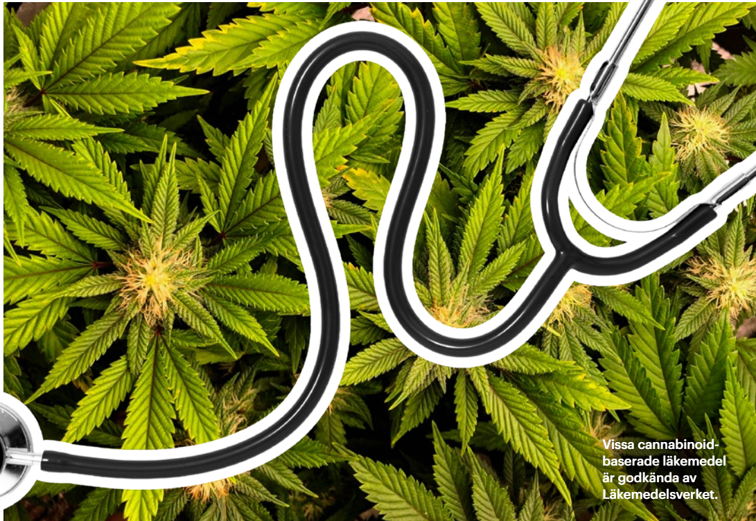
Vissa cannabinoid-baserade läkemedel är godkända av Läkemedelsverket.